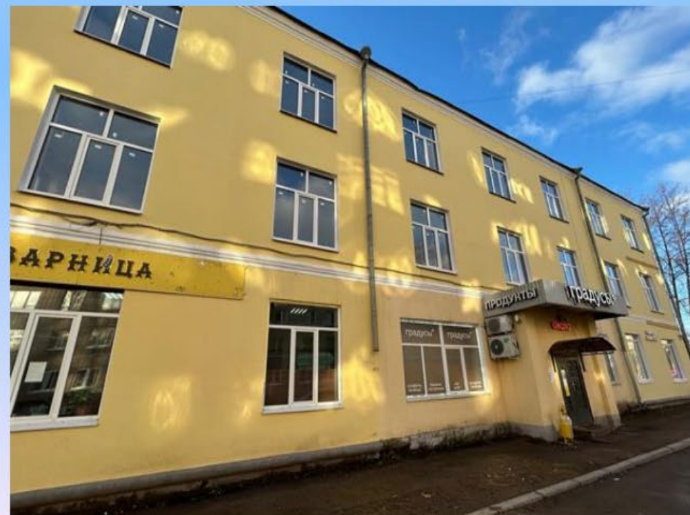
Фото объекта после